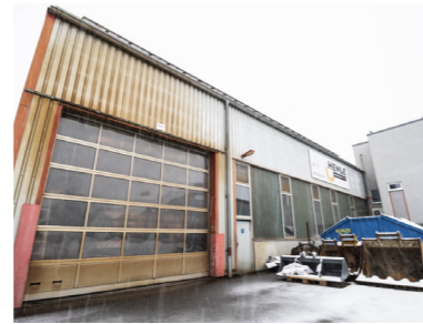
ZWEITE PRODUKTIONSHALLE mit Verwaltungsgebäude wird gebaut