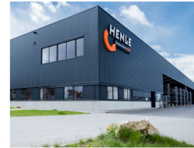
GRÖBTESTES BAUPROJEKT Mit der vierten Produktionshalle wächst das Unternehmen stark