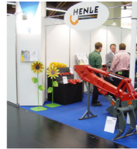
ERSTE MESSE HENLE präsentiert sich auf der GalaBau