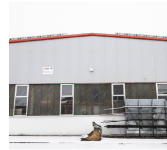
DRITTE HALLE wird in Rammingen gebaut