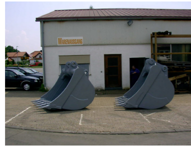
ERSTE EIGENEN PRODUKTE Die ersten Löffel werden entwickelt und gebaut